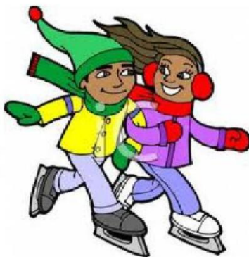
Кататься на коньках