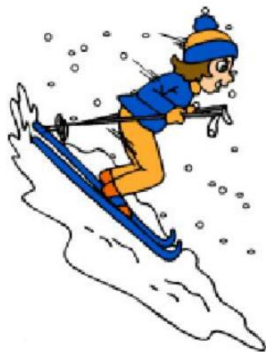
Кататься на лыжах