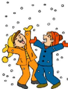
Играть на улице