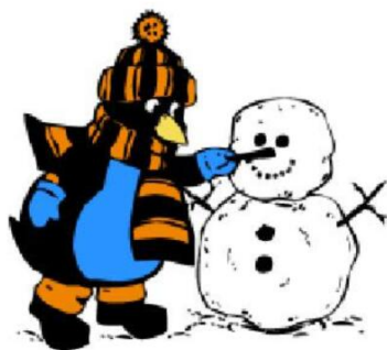
Лепить снеговика лесу