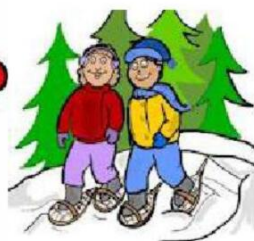
Гулять в зимнем лесе