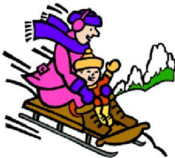
Кататься на санках