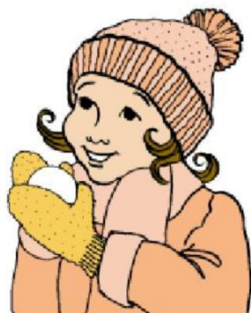
Играть в снежки