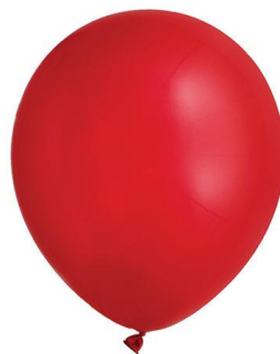
Un ballon rouge