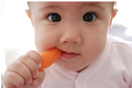
Le bébé mange une carotte.