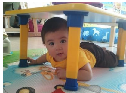
Le bébé est sous la table.