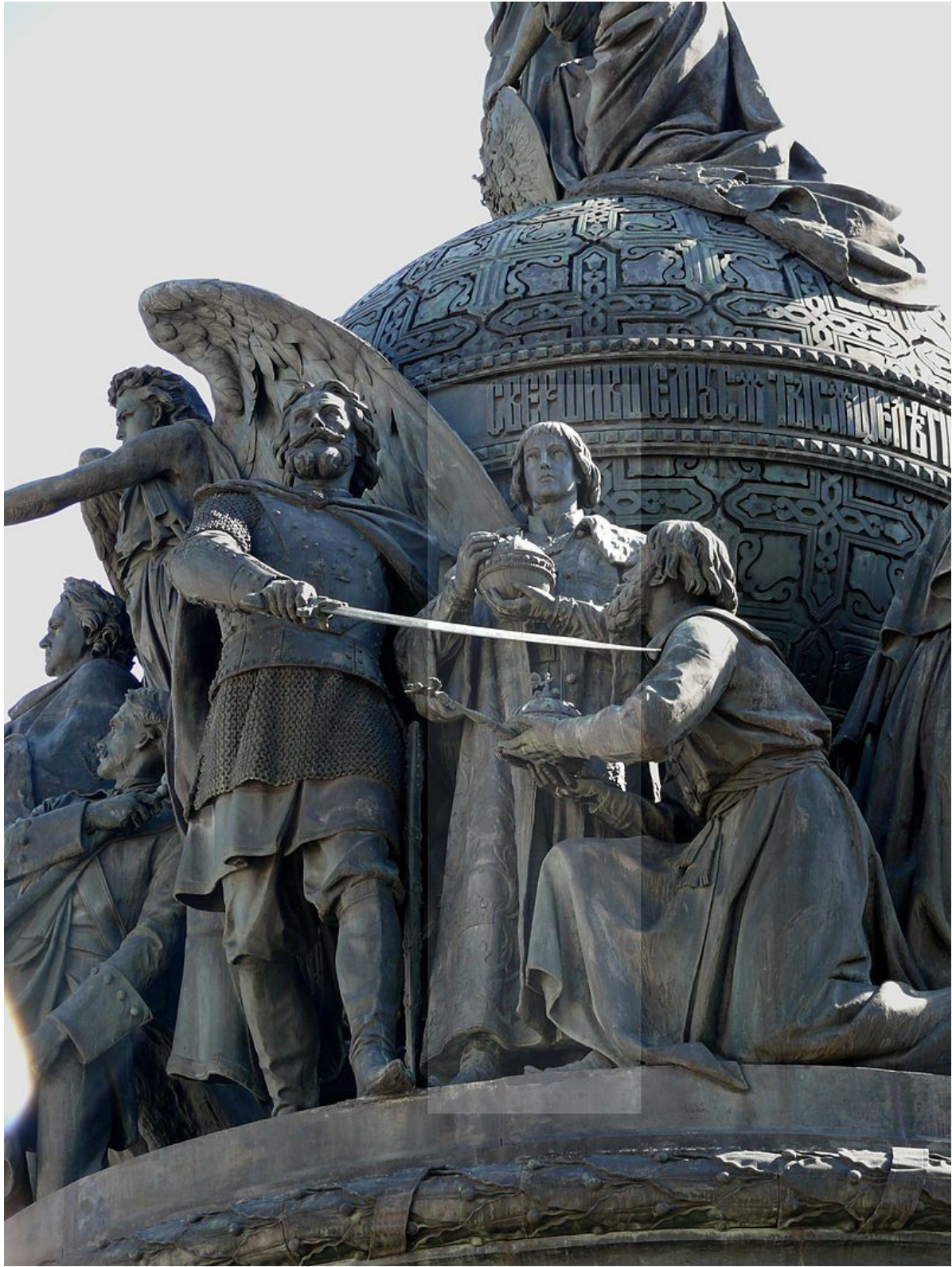
Князь Пожарский, Михаил Романов и Козьма Минин.