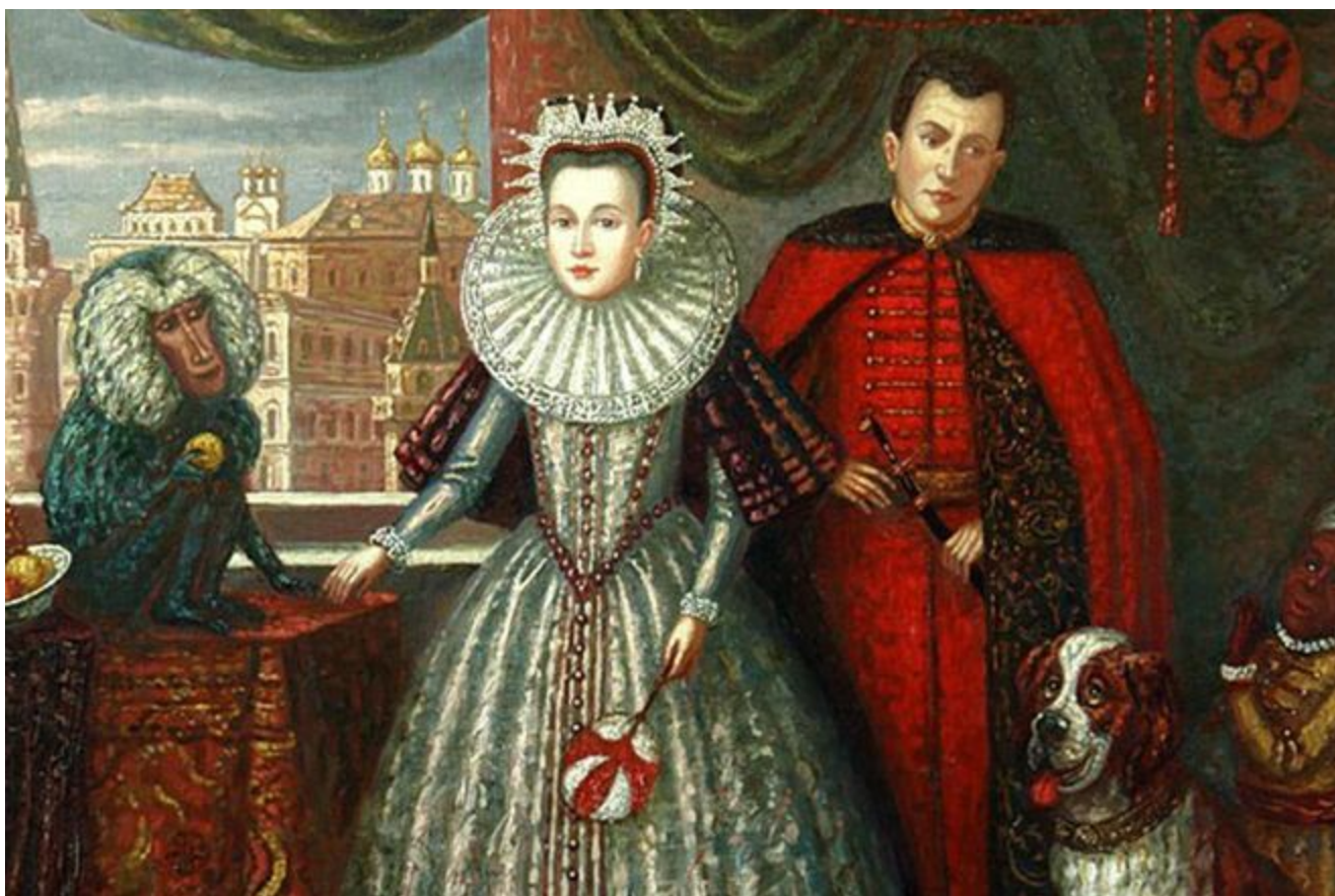
Лжедмитрий и Марина Мнишек.