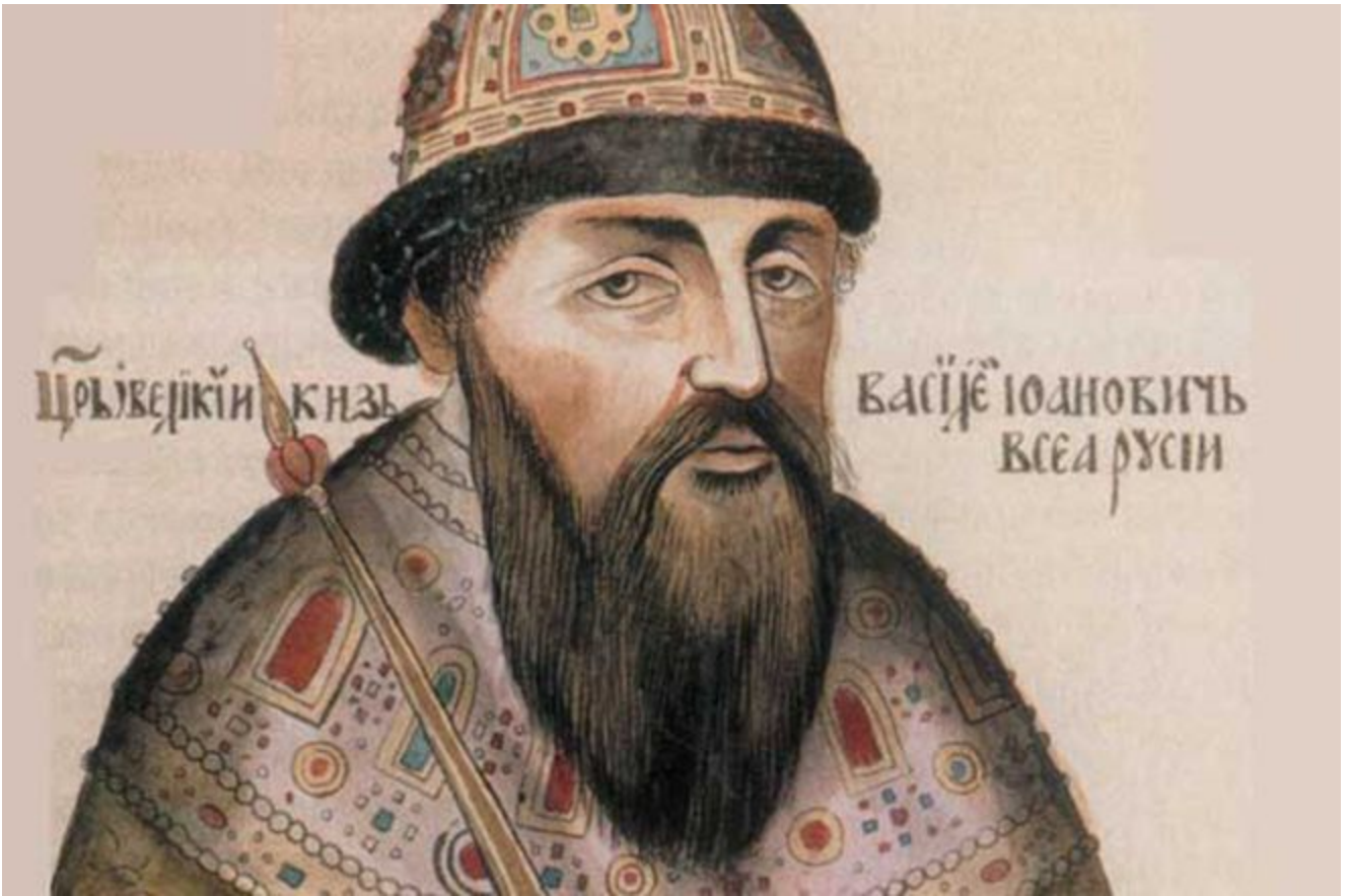
Князь Василий Шуйский