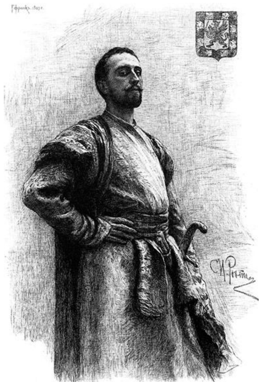
И.Е. Репин Фёдор Никитич Романов