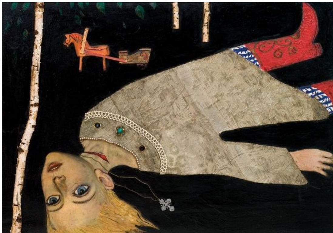
Царевич Димитрий Убиенный. Художник Илья Глазунов.