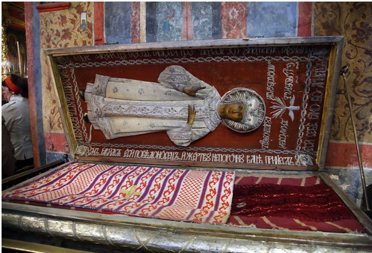
Гроб Царевича Дмитрия в Успенском Соборе Кремля.