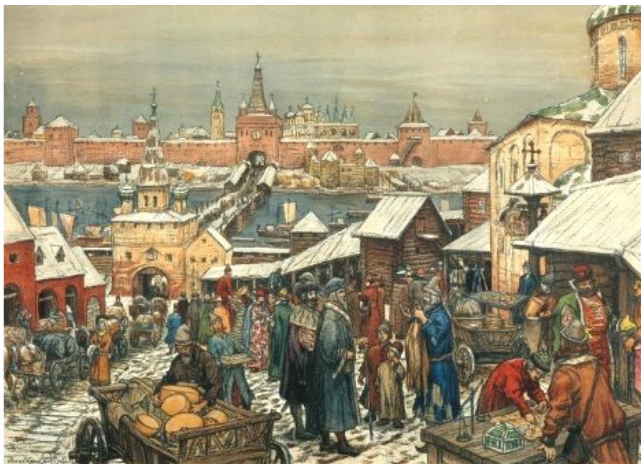
Средневековый Новгород (картина Аполлинария Васнецова)

Сын Ярослава Александр еще ребенком был послан отцом княжить в Новгороде. Новгород в то время был республикой, и городом управлял посадник, которого избирали местные жители. Князей приглашали на время для командования дружиной и защиты города от неприятеля.